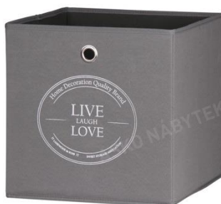
Úložný box Alfa, 269 Kč