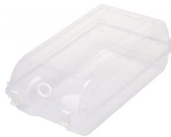
Úložný box na obuv, 129 Kč