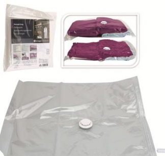
Vakuové pytle, 179 Kč