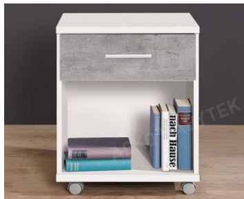
Úložný kontejner na kolečkách Joker, 2 799 Kč