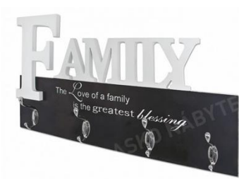
Nástěnný věšákový panel Family, 659 Kč